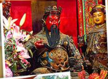
วัดหลินฟาง