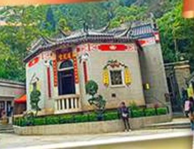
องค์อ้อยส้ม